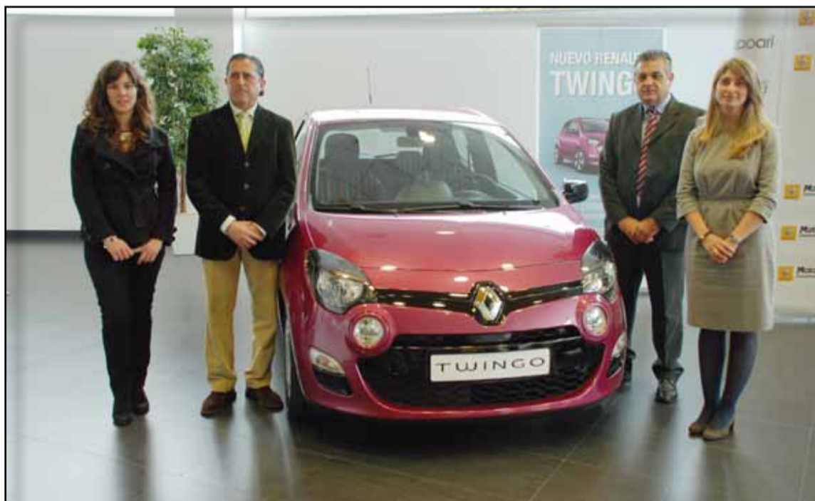
Económico y respetuoso con el medio ambiente. Desde 3,4 l/100Km y 90 g de CO2.