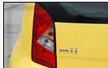
Detalle trasero de identificación.

el marcado diseño en forma de flecha. Los faros delanteros son grandes, llamativos y ricos en detalles, con unos perfiles afilados que confieren una imagen contundente.