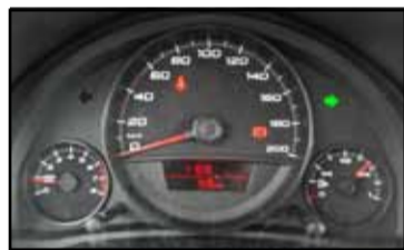
Cuadro con ordenador.