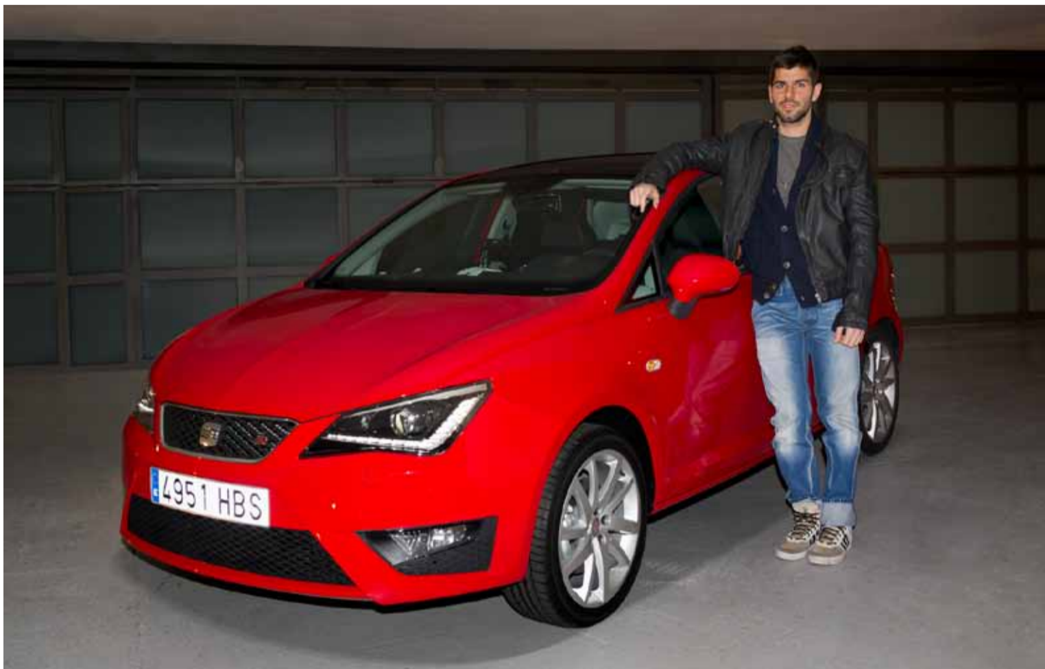
Jaime Alguersuari condujo el nuevo Seat Ibiza por las calles de su ciudad natal, Barcelona.

Jaime Alguersuari no es sólo un joven piloto, sino también un exitoso artista musical bajo el nombre de Squire. Antes de una de sus actuaciones, el piloto barcelonés tuvo la oportunidad de probar el nuevo SEAT Ibiza. Sus primeras impresiones fueron concluyentes: "Es muy ligero, y con una gran potencia para el peso que tiene. Como todos los SEAT es un coche fácil de conducir, y sobre todo, muy deportivo".