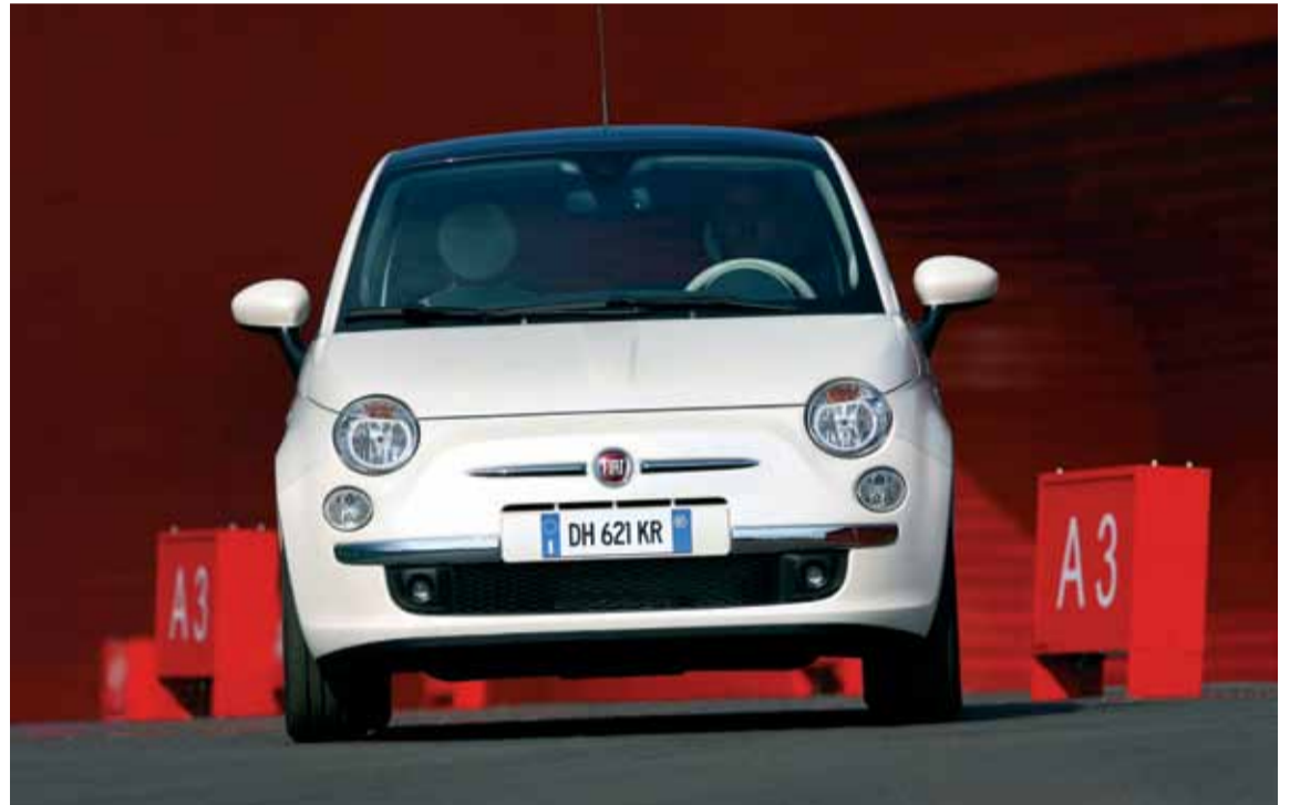
Una financiación excepcional con un TAE reducido, SIN ENTRADA y con 4 AÑOS DE GARANTÍA.