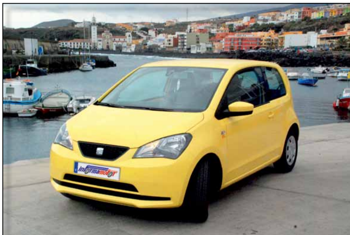
Interpretación de SEAT del coche urbano del siglo XXI.

El frontal del Mii presenta el típico y expresivo concepto "Arrow Design" de SEAT. La parrilla de forma trapezoidal y provista de un marco negro resalta el logotipo de la marca sobre una rejilla en panel de abeja, mientras que el contorno del capó adopta el motivo en forma de V, reforzando así