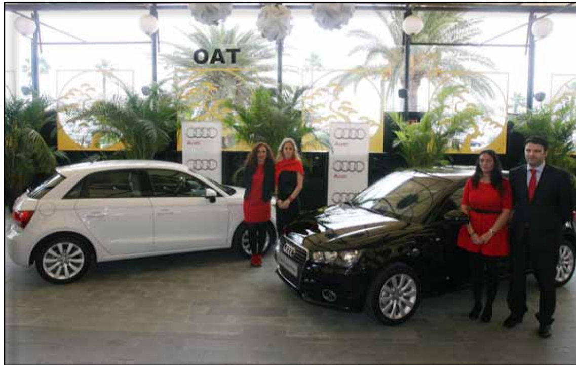
Los clientes del A1 Sportback lo pueden adaptar a su estilo con colores frescos y con gran número de atractivos detalles.

tros de anchura y 1,42 metros de altura, lo que hace que el espacio para las plazas de los asientos traseros sea realmente cómodas. Audi ofrece de serie el A1 Sportback su versión de 5 plazas.