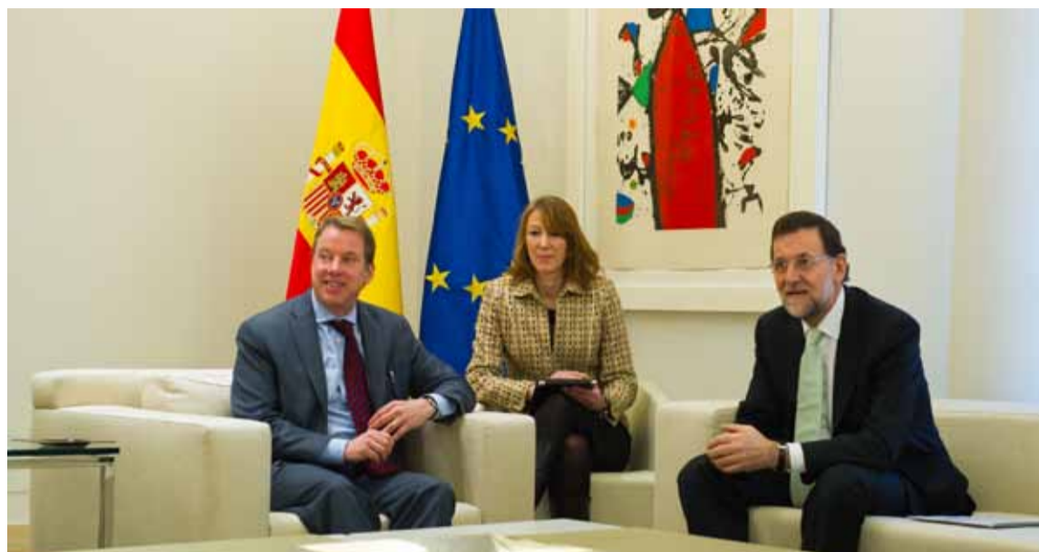
El Presidente Ejecutivo de Ford Motor Company, William Clay Ford Jr., en un momento de la reunión mantenida con, el actual Presidente del Gobierno de España, Mariano Rajoy.