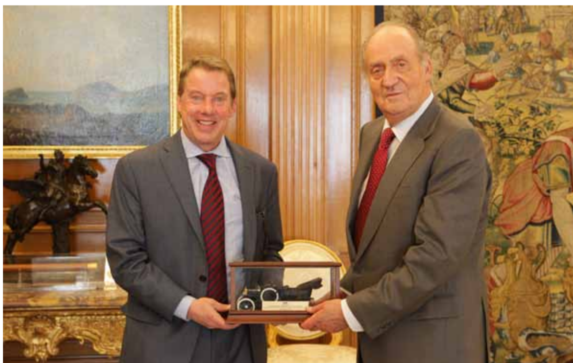
El Presidente Ejecutivo de Ford Motor Company, William Clay Ford Jr., hace entrega a Su Majestad el Rey de una maqueta de un Ford T.