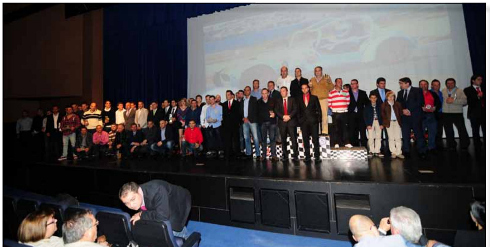
Conjunto de galardonados.

Texto: Redacción