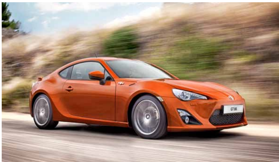
El esperado Toyota GT 86 se comercializará en toda Europa a partir del verano.

Los prototipos Toyota NS4 y FCV-R se estrenarán a escala europea. El Toyota NS4 es un vehículo híbrido enchu-