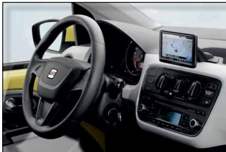
El Portable System es entretenimiento, navegación, conectividad Bluetooth, etc.