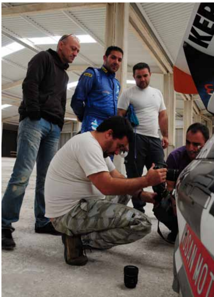
Elos trabajos colaboraron muchos amigos.