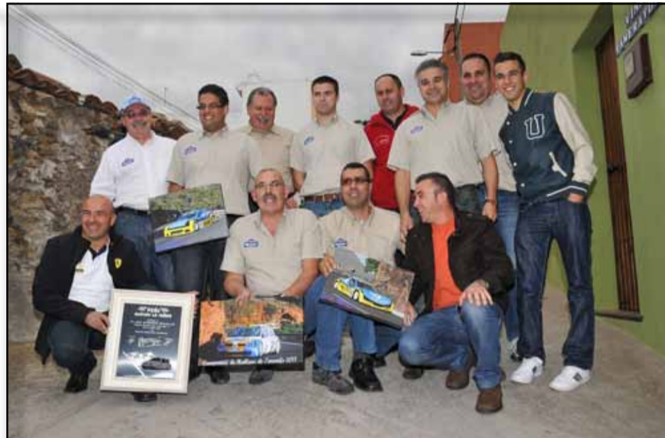
Galardonados, familiares, amigos y componentes de la Peña Racing La Verga pasaron una agradable jornada.