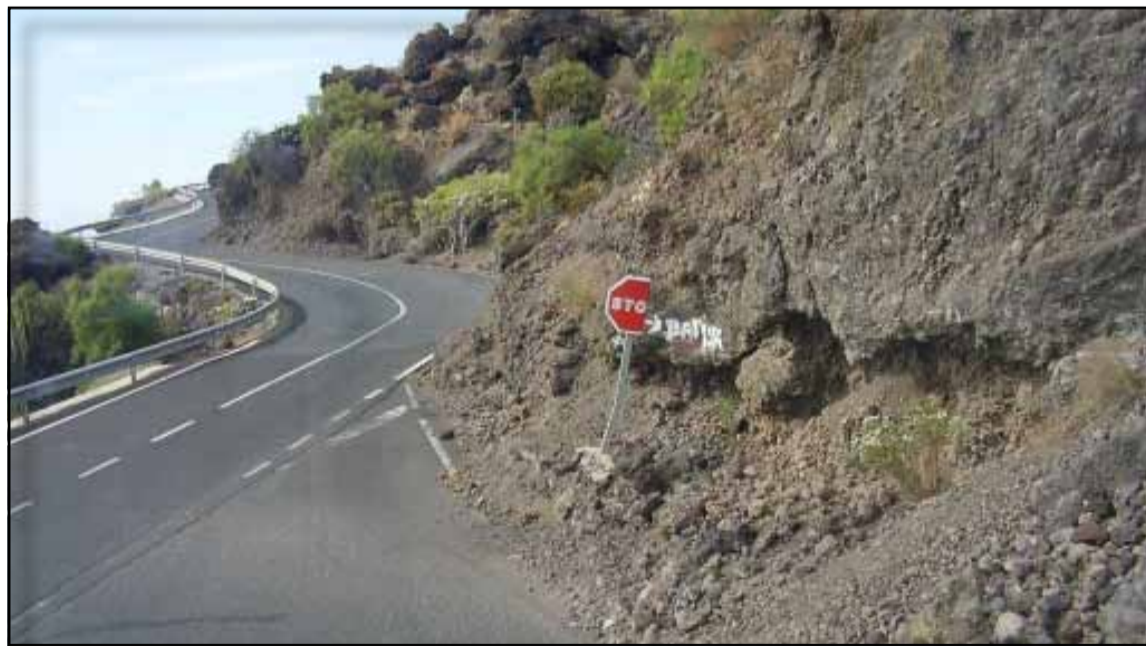
Vemos el lamentable estado de la señalización bajando de Guía de Isora hacia Playa San Juan.