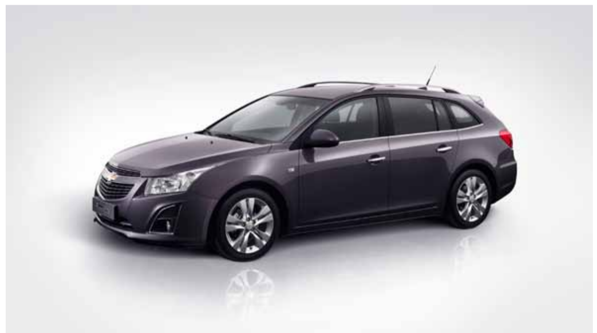
El nuevo sistema de información y ocio Chevrolet MyLink integra a la perfección los dispositivos personales del conductor.

Todos los modelos del Cruze estarán disponibles con cinco nuevos trenes motrices a partir del verano de 2012. Además de los actuales motores de gasolina de 1,6 y 1,8 litros, la oferta de trenes motrices se completará con un nuevo motor de gasolina turbo de 1,4 litros, un diésel nuevo de 1,7 litros y un diésel mejorado de 2 litros. Todos los