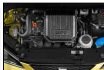
El motor de 75 CV.