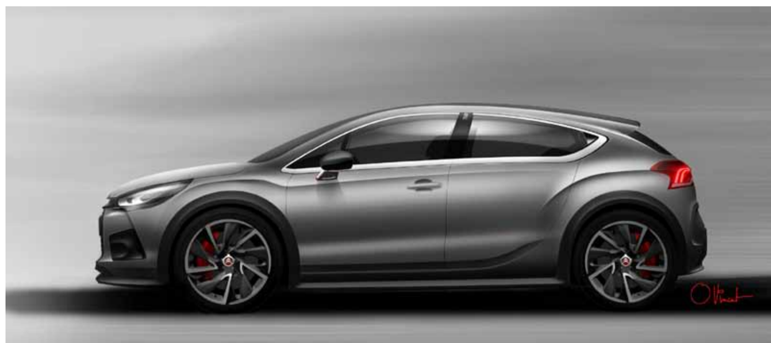
Entre las muchas novedades de la marca estará presente el Citroën DS4 Racing Concept.

Además del DS4 Racing Concept, de momento un ejercicio de estilo, la línea DS tendrá un lugar destacado en el stand Citroën. Habrá novedades como el Citroën DS5 Hybrid4, pionero de la tecnología híbrida diésel, que combina las ventajas de la propulsión eléctrica con la de un motor diésel HDi. También estarán presentes los Citroën DS3 Racing S.Loeb, DS3 Ultraprestige, DS4 Paris Rendez-Vous y DS5 Paris Rendez-Vous.