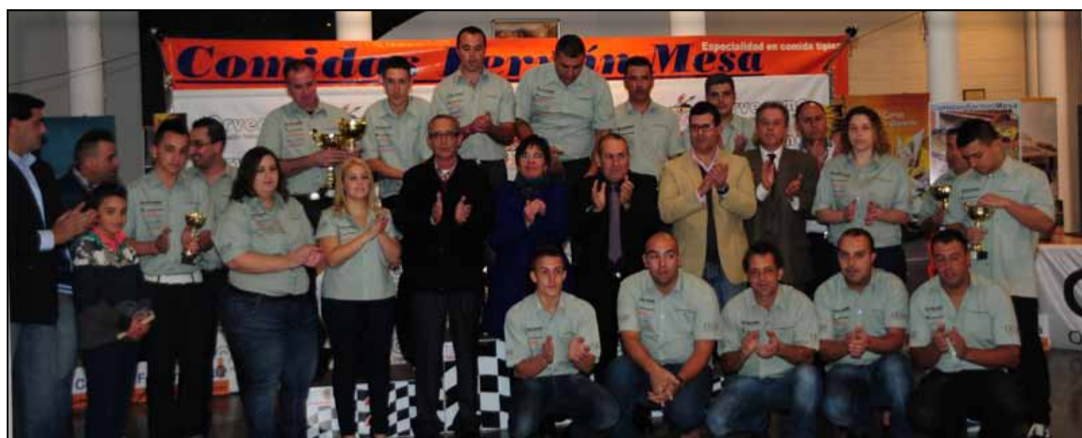
Buen ambiente en una veterana competición que culmina cada año con el broche final que representa la entrega de trofeos.

* Valederos tres resultados en la temporada.