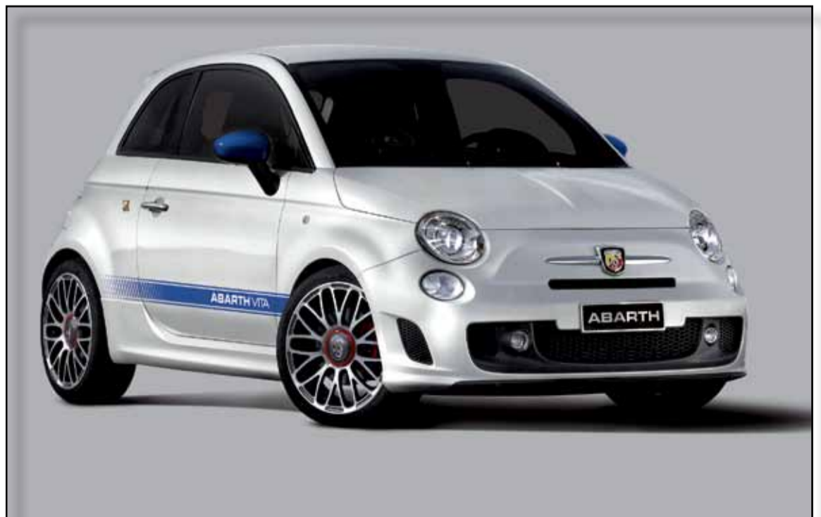
La diversión se eleva a la máxima potencia con el nuevo y exclusivo Abarth 500 VITA.