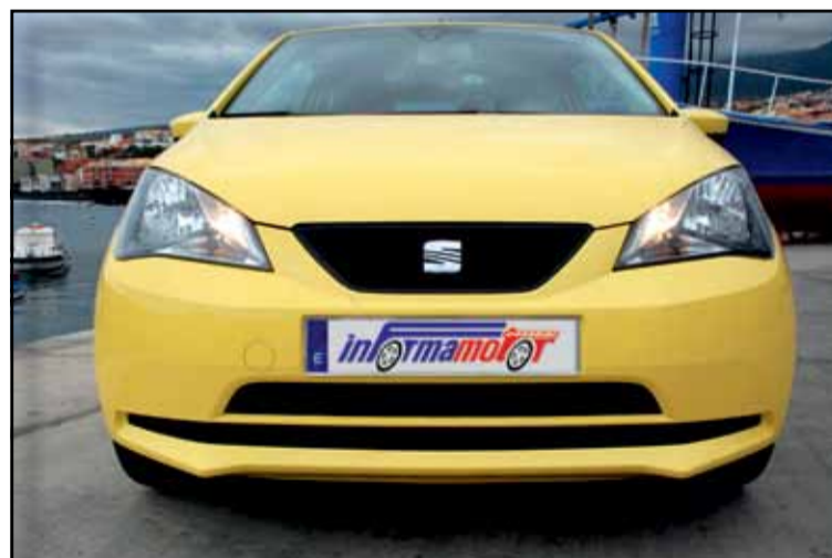
Incluido de serie el ESC (Control Electrónico de Estabilidad) y luz diurna.