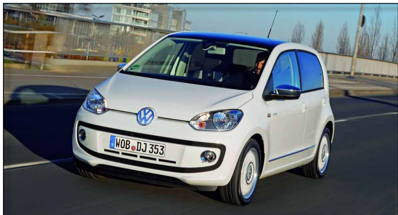
A mediados de año Volkswagen Canarias ofrecerá a sus clientes la versión de cuatro puertas para cuatro personas del Volkswagen más urbano.