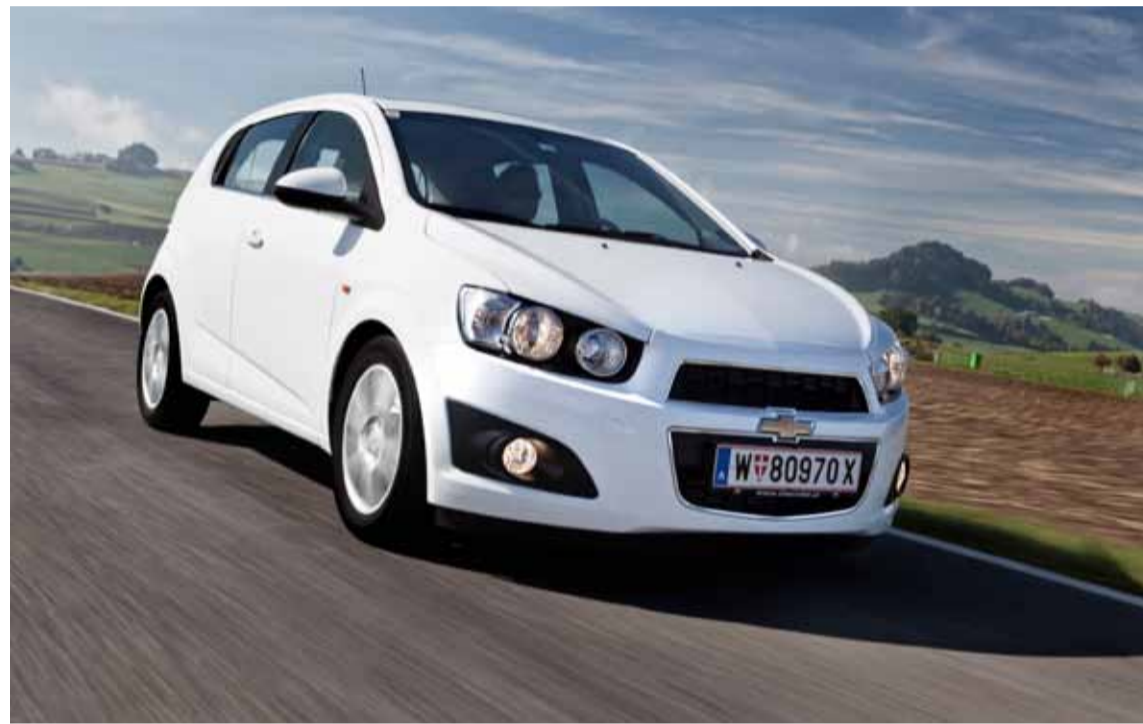
El Aveo contará próximamente con un nuevo sistema de información y ocio, llamado Chevrolet MyLink,

La mayoría de versiones de gasolina también se ofrecen ahora con dirección asistida eléctrica y función Start/Stop.