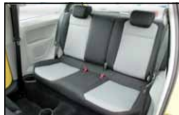
Aprovechamiento óptimo del espacio.